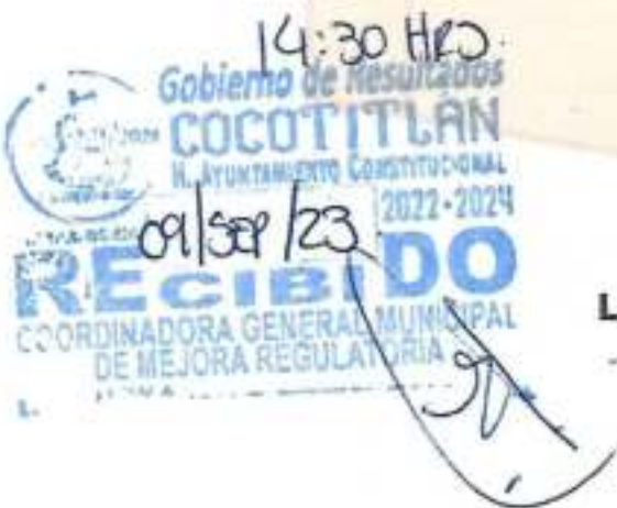
L.C.P ALFONSO MOYSEN TAPIA. - CONTRALOR MUNICIPAL